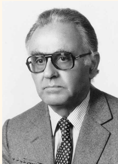
Δημήτριος Π. Λαζαρίδης. Καθηγητής Χειρουργικής Α.Π.Θ., Πρόεδρος της Ι.Ε.Θ. (1976, 1977, 1978, 1979, 1980).