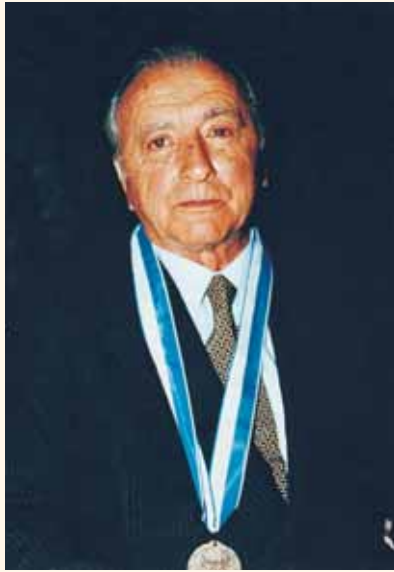
Ιωάννης Κ. Παπαπαναγιώτου. Καθηγητής Μικροβιολογίας Α.Π.Θ., Πρόεδρος της Ι.Ε.Θ. (1975, 1976).