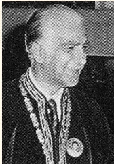
Κωνσταντίνος Π. Σταυρόπουλος. Καθηγητής Πνευμονολογίας - Φυματιολογίας Α.Π.Θ., Πρόεδρος της Ι.Ε.Θ. (1972).

Για κάποιους απαξιωτικούς, μικροπρεπείς και «μικροπολιτικούς» λόγους (το Δ.Σ. του Νοσοκομείου Σανατορίου Ασβεστοχωρίου - Ν.Σ.Α., δεν παραχωρούσε αξιοπρεπείς χώρους για εγκατάσταση