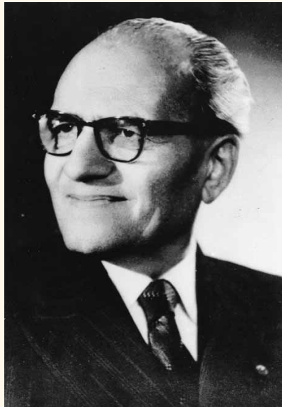
Αναστάσιος Μισιρλόγλου. Καθηγητής Χειρουργικής του Α.Π.Θ., Πρόεδρος της Ι.Ε.Θ. (1937, 1938, 1939, 1940, 1941).