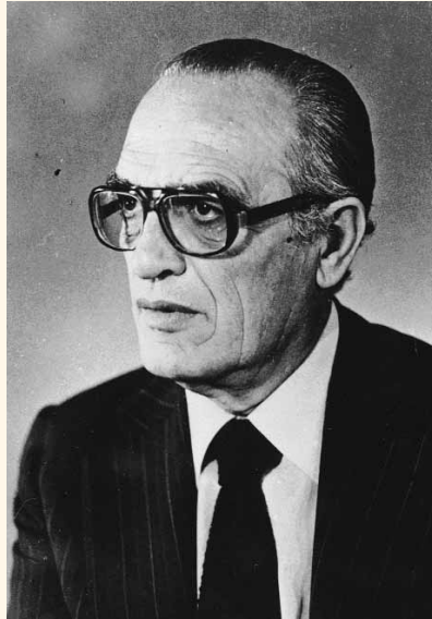
Κωνσταντίνος Τούντας. Καθηγητής Χειρουργικής Α.Π.Θ., Πρόεδρος της Ι.Ε.Θ. (1967, 1968).