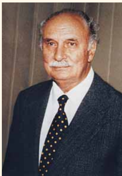
Γουλιέλμος Τσουρουτσόγλου. Καθηγητής Παθολογίας Α.Π.Θ., Πρόεδρος της Ι.Ε.Θ. (1981, 1982, 1983, 1984).