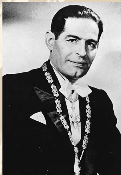
Γεώργιος Τσουτσουλόπουλος. Καθηγητής Μαιευτικής - Γυναικολογίας, Πρόεδρος της Ι.Ε.Θ. (1962). (Αρχειο Ι.Ε.Θ.)

Το 1945 εξελέγη τακτικός Καθηγητής της Μαιευτικής και Γυναικολογικής Κλινικής της Ιατρικής Σχολής Θεσσαλονίκης, θέση στην οποία θύεψε επί είκοσι περίπου χρόνια. Εξελέγη Κοσμήτορας της Σχολής και Πρύτανης του Πανεπιστημίου