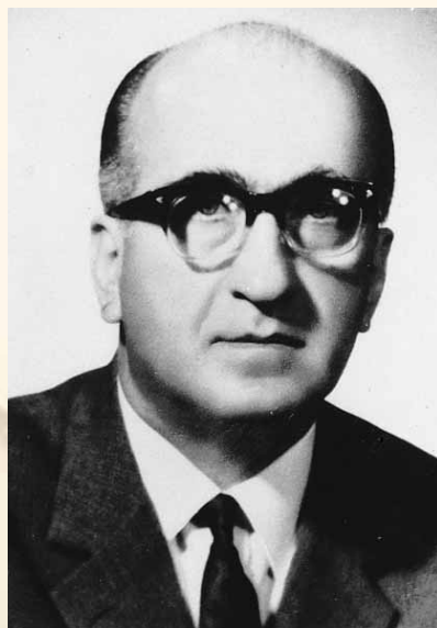
Δημήτριος Βαλτής. Καθηγητής Παθολογίας Α.Π.Θ., Πρόεδρος της Ι.Ε.Θ. (1969, 1970, 1971).

Αντιπρόεδρος του «Ωνασείου Καρδιοχειρουργικού Κέντρου» και από το 1985 συνεχίζει την προσφορά του στην επιστήμη και την Ελληνική κοινωνία ως τακτικό μέλος της Ακαδημίας Αθηνών.