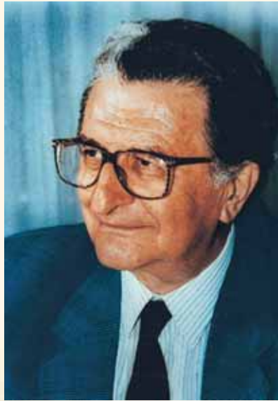
Χαράλαμπος Ν Σμπαρούνης. Καθηγητής Χειρουργικής Α.Π.Θ., Πρόεδρος της Ι.Ε.Θ. (1985, 1986, 1987-89, 1993-95, 1995-97).