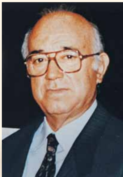
Ζαχαρίας Σινάκος. Καθηγητής Παθολογίας - Αιματολογίας Α.Π.Θ., Πρόεδρος της Ι.Ε.Θ. (1997-99, 1999-01).

σε Πρόεδρος του Τμήματος Ιατρικής του Α.Π.Θ. συμβάλλοντας καθοριστικά στην εφαρμογή καινοφανών θεσμών και διαδικασιών.