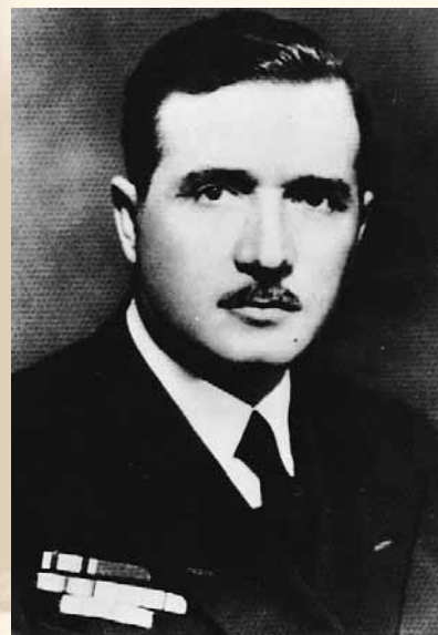
Μαρίνος Σιγάλας. Καθηγητής Χειρουργικής, Πρόεδρος της Ι.Ε.Θ. (1949, 1950, 1951).

6. Πολυζωΐδης Στ. Μισός αιώνας με τον ιατρικό κόσμο της Θεσσαλονίκης. Ιατρικός Σύλλογος Θεσσαλονίκης, 1990.