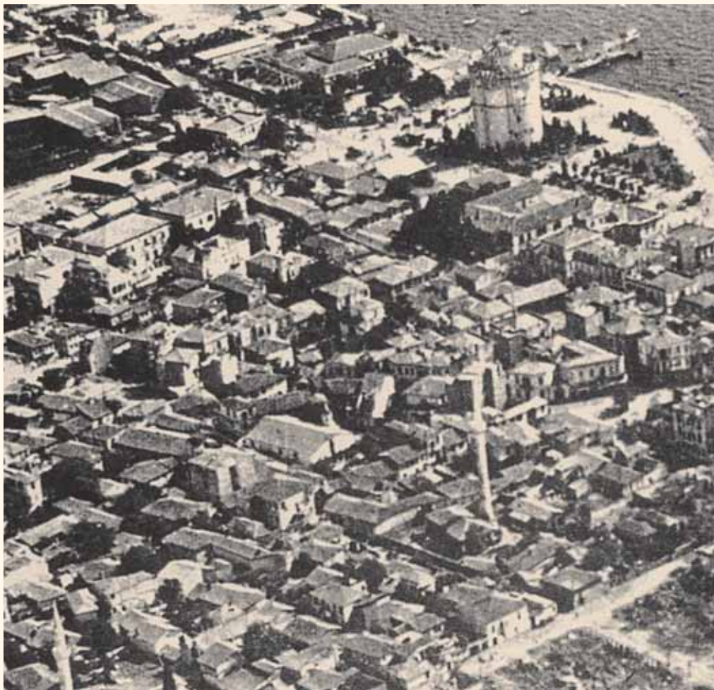
Θεσσαλονίκη. Η περιοχή της Νέας Παναγιάς μετά την πυρκαγιά του 1917. (Δημοσιεύθηκε στο βιβλίο «Τα Μυστήρια της Θεσσαλονίκης» του Ε. Χεκίμογλου).

Οι εστίες των επιδημιών δεν ήταν μόνο οι ακάθαρτοι δρόμοι και οι ελεύθεροι χώροι όπου στιβάζονταν φόπιες γάτες, σκύλοι, αγελάδες που παρέμεναν εκεί μέχρι να αποσυντεθούν και να μεταφερθούν τα κορμάτια τους από άλλα ζώα σε άλλες περιοχές προκαλώντας έτσι διασπορά μολυσματικών υλικών. Ο Αυστριακός προξενικός ιατρός στη Θεσσαλονίκη Ρατβάνερ σημειώνει: «Αν κοιτάξει κανείς τους στενούς ακάθαρτους σκοτεινούς δρόμους όπου στιβάζονται σκουπίδια, ακαθαρσίες σε μεγάλους όγκους και όχι σπάνια πτώματα των πιο διαφορετικών ζώων σε ημιαποσύνθεση προσβάλλουν τα αισθητήρια όργανα και ιδιαίτερα της οσμής. Ευτυχώς οι τόσο ακάθαρτοι δρόμοι καθαρίζονται εν μέρει από τις αγέλες των αδέσποτων σκύλων που τρέχουν από εδώ και από εκεί».