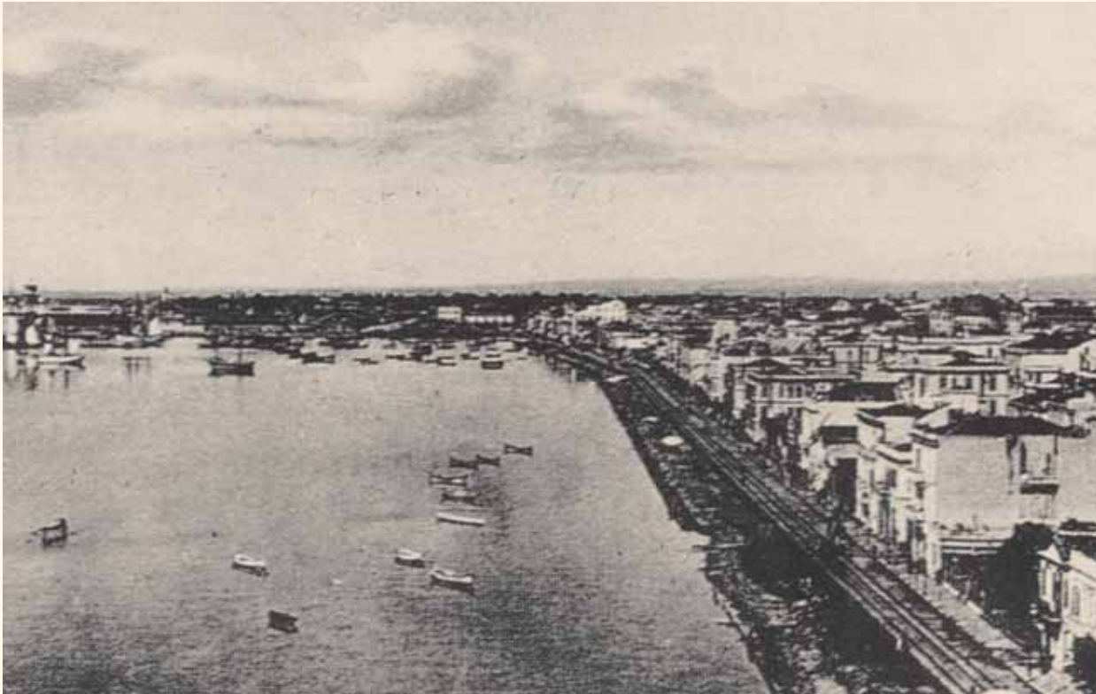
Θεσσαλονίκη (1904 - 1906). Επέκταση της παραλίας